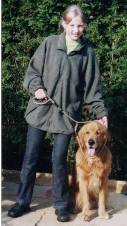
Foto 3. De juiste wijze als de hond links is

Na een correctie moet gedragsverandering optreden, gebeurd dat niet is de correctie niet goed geweest. Door de korte krachtige ruk zal de lijn aanspannen en op de plek waar het uiteinde middels een metalen ring om de lijn vast zit a.h.w. een beet in de nek nabootsen. Als de hond hierop reageert door netjes naast ons te komen lopen zal meteen de spanning van de lijn afgaan en zal deze weer los om de nek van de hond komen. Zal de hond zonder dat men iets verandert nu aan de rechterkant gaan lopen en men doet hetzelfde, zal de lijn bij een korte stevige ruk wel aantrekken, maar bij goed gedrag niet meer lossen gaan zitten. Dus blijft de lijn de hond constant corrigeren, ook als de hond gewenst gedrag vertoont. De kracht van dit soort slijplijnen is dat men, mits goed gebruikt, ongewenst gedrag kan corrigeren tot gewenst gedrag door een natuurlijke nabootsing middels een beet in de nek. En dat is taal die een hond verstaat. Kortom, kiest men voor een jachtlijntje is het belangrijk de hond altijd aan dezelfde kant te hebben en ervoor te zorgen dat de lijn goed omzit. Consequentie is in de training van de hond een belangrijk sleutelwoord.