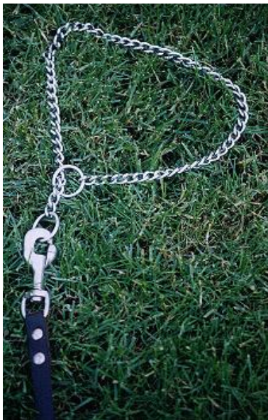
Foto 1 De slipketting

Momenteel zijn er veel nieuwe methodes, echter nog heel veel mensen hebben een slipketting (foto 1) of een jachtlijntje (foto 2). Vandaar dat ik dit middel als eerste wil behandelen. De werking is in principe van beide gelijk. Echter niet iedereen is op de hoogte van de juiste toepassing ervan en doet de lijn willekeurig om en laat de hond zowel links als rechts lopen waardoor de kans fifty fifty is dat de lijn goed om zit.